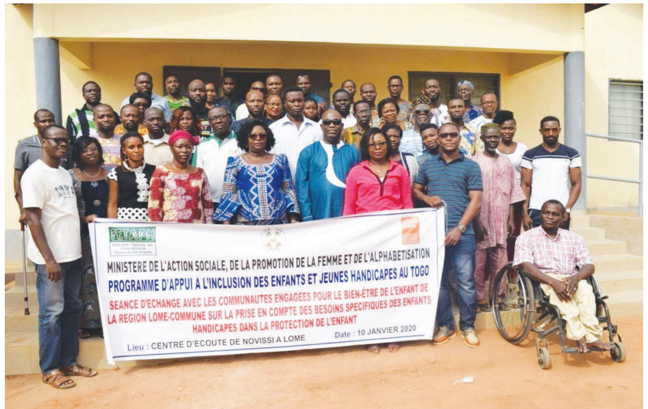
Photo de famille à l'issue de la cérémonie d'ouverture.