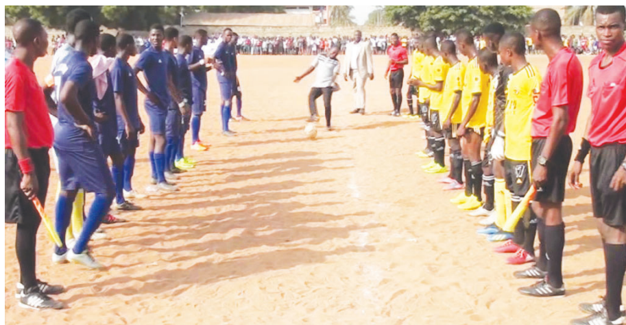
Coup d'envoi de la finale.

A la reprise, le Lycée Lomé-Port prend de l'ascendance en multipliant des actions dangereuses. Confiants, les joueurs du CS Le Savoir vont répondre du toc au toc ; des occasions qui resteront infructueuses jusqu'à la 68 e mn où Mathias Outoglo du CS Le Savoir va inscrire l'unique but de