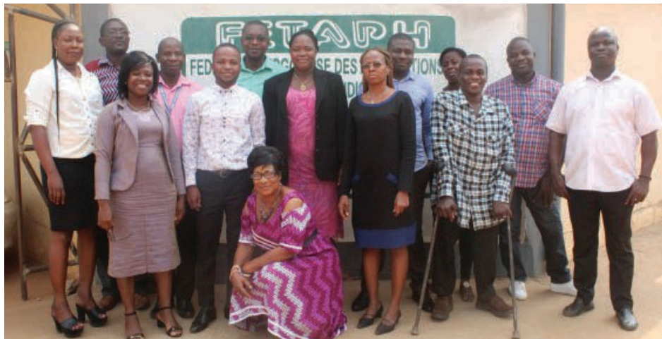
Vue d'ensemble du personnel de la direction de programme de la FETAPH et des délégués des OP.

les représentants des organisations locales partenaires. Il a permis d'orienter les participants sur les processus d'élaboration participative d'une politique et des procédures de