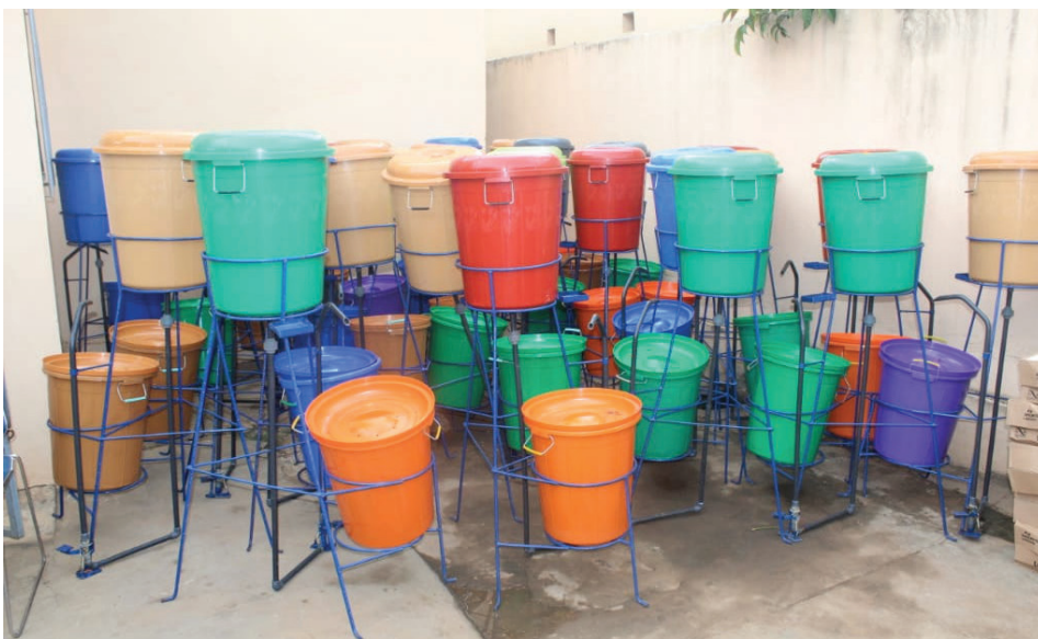
Les kits offerts à la FETAPH

personnes handicapées ne sont pas habilitées à comprendre le langage des signes conventionnels, a souligné le président du conseil d'administration de