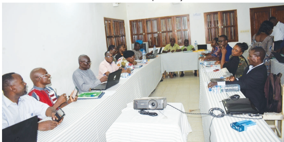
L'ensemble des délégués à l'atelier.