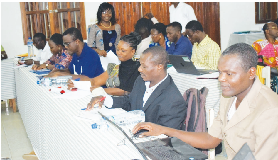
Vue partielle des participants.

Cette formation se situe dans le cadre de la mise en œuvre du plan de développement organisationnel de la FETAPH issu de son diagnostic réalisé en 2018 et devant couvrir la période 2018-2022. En effet, ce plan de développement quinquennal prend en compte trois axes d'orientation à savoir : l'harmonisation du dispositif organisationnel aux normes statutaires, aux valeurs et aux besoins de la FETAPH ; le développement de mécanismes en management stratégique ; et la promotion de dispositifs internes et de compétences de renforcement des capacités. Par rapport à l'axe 2, l'une des actions prioritaires pour stimuler le management stratégique de la FETAPH est l'élaboration et la mise en œuvre des outils de planification, de suivi-évaluation et gestion de qualité. Dans le cadre de ce 2 e axe, un consultant a été recruté par la FETAPH, avec pour mission d'élaborer