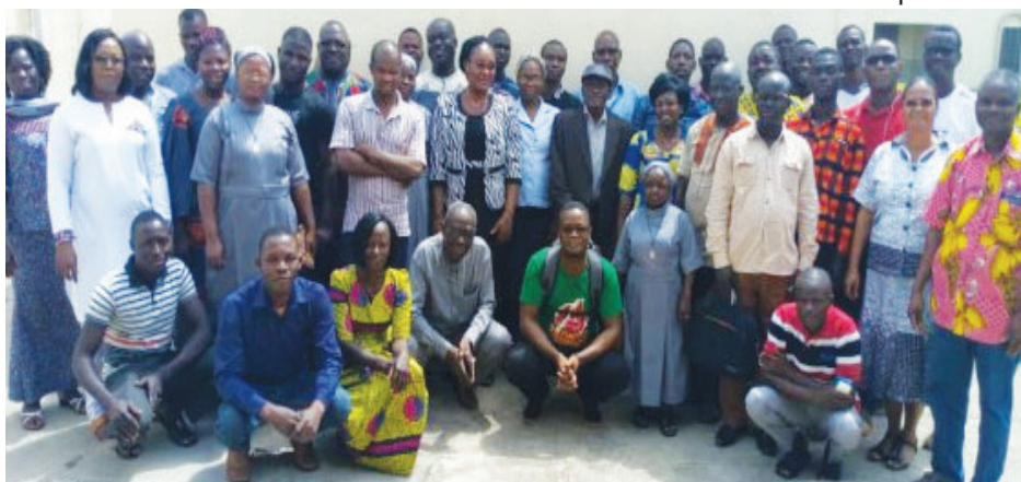
Les participants à l'atelier ont posé pour la postérité.

Deux jours durant, la rencontre a permis de s'informer sur les objectifs et les résultats attendus du réseau des organisations partenaires du Togo au cours de l'année 2020. Les différentes activités planifiées notamment l'organisation de l'action « Tirer la sonnette » et celles relatives au renforcement de capacités des organisations partenaires et de leur visibilité ont fait l'objet de discussions. Les organisations partenaires et celles de personnes handicapées impliquées dans la réalisation de la campagne « Tirer la Sonnette » 2019 ont partagé leurs expériences avec d'autres qui se préparent à animer ce genre de campagne pour la première fois en 2020.